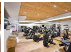
Gestaltung: atelier-cat